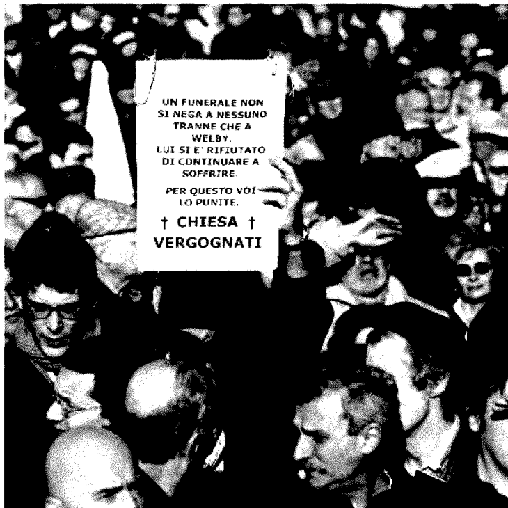
L'ultimo saluto laico. La folla che si ritrovò in piazza San Giovanni Bosco a Roma nel dicembre 2006 per il «funerale» di Piergiorgio Welby

La laicità trascende qualsiasi manifesto dei valori. A sfondo religioso Un libro per capire perché